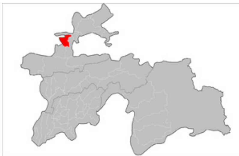
Расми 1. Мавқеи ҷуғрофии шаҳри Истаравшан.

Масоҳати умумии шаҳри Истаравшан 7,6 ҳазор км 2 буда, он мутаносибан 0,2 дарсади масоҳати умумии вилояти Суғдро ташкил медиҳад. Истаравшан аз маркази шаҳр (бо фарогирии 22 маҳалла), 10 ҷамоат (ҷамоатҳои Гули Сурх, Коммунизм, Қалъаи Баланд, Ленинобод, Ниҷонӣ, Нофароҷ, Правда, Пошкент, Ҷавкандак ва Фрунзе) ва 68 деҳа иборат аст. Шаҳр дар қисмати шимолии доманаи қаторкӯҳи Туркистон, дар масофаи 70 км дар қисмати ҷанубу ғарбии маркази вилояти Суғд воқеъ буда, аз тарафи шимолу ғарб бо вилояти Сирдарёи Ҷумҳурии Ўзбекистон ҳаммарз мебошад.