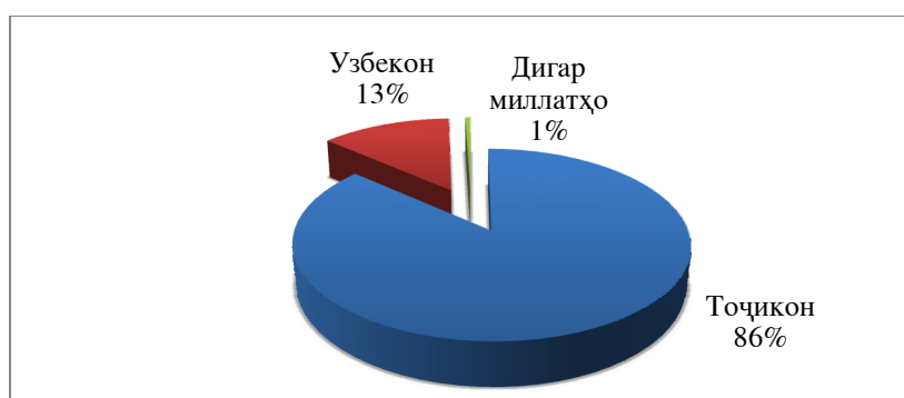
Диаграммаи 1. Ҳайати миллии аҳолии шаҳри Истаравшан.

Дар ҳайати миллии аҳолии шаҳр тоҷикон нақши муайянкунанда дошта 86% шумораи аҳолиро ташкил менамоянд. Сохтори этникии шаҳр гуногунмиллат буда, ўзбекҳо 13% ва дигар миллатҳо 1%-ро ташкил медиҳанд.